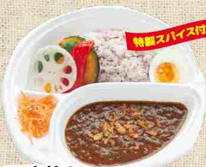
三連蔵カレー 900円 (税込)