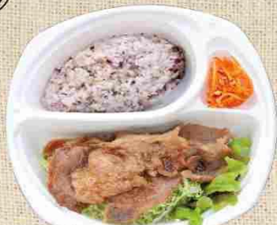
ジンジャーポーク 1100円 (税込)