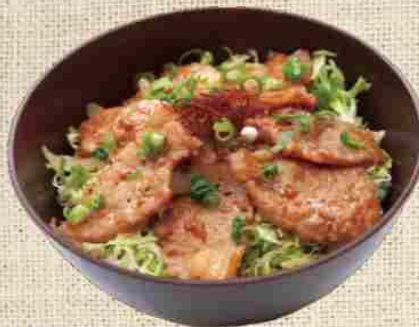
熟成ぶたじん丼 1100円 (税込)