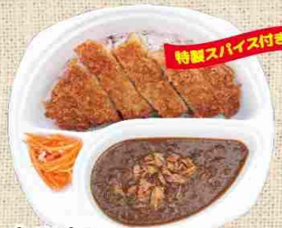
カツカレー 1,300円 (税込)